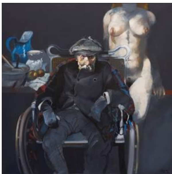
Viejo pintor , 1980 Acrílico sobre tela, 150 x 150 cm Propiedad del artista

Gustave Courbet es otra imagen histórica: la del artista que reúne vanguardia política y artística. Sin embargo, Alonso no representa al Courbet que puso su gloria al servicio de la Comuna de París en 1871, condenado a la prisión, al exilio y al olvido hasta la muerte. En la pintura de Alonso, Courbet es el artista con su caballete frente a los bosques, que pinta fielmente en la tela, o el que tiene la mesa de trabajo cubierta con frutas para naturalezas muertas, entremezcladas con las herramientas y materiales del oficio. Courbet es el deseo de la pintura en plena vitalidad. Uno de los cuadros más interesantes de la vejez de un pintor es Cataratas , de 1986: Monet se encuentra en el fondo de la tela, la manta que lo cubre ocupa la mayor parte de la escena, el estampado parece proponer una abstracción resultado de los problemas de visión del artista. También Monet había sido filmado por Sacha Guitry en los jardines de Giverny. La vejez y la muerte son una constante en la mirada de Alonso; la obra dedicada a Egon Schiele logra potenciar la extraña delicadeza de las fotografías del artista muerto en su cama en 1918.