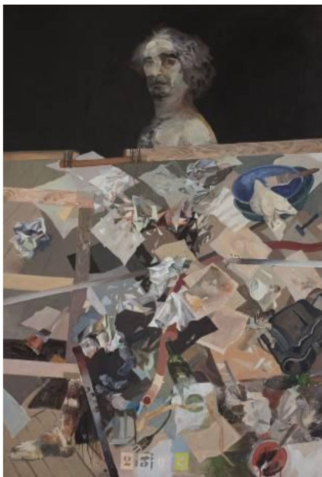
Inventario Nro. 1, 1979 Acrílico sobre tela, 196 x 130 cm Propiedad del artista

Alonso trabaja como un individuo en una sociedad que poco o ningún caso hace de él, que se ha embarcado en otro proyecto artístico invasor. Pero llegados a este punto, convendría recordar ciertos conceptos de Hauser: “Una personalidad creadora que siente, piensa, obra y realiza individualmente sólo aparece como fenómeno de reacción; corporeiza siempre una réplica a una cuestión o una respuesta a una provocación. Un artista sólo se forma en el curso de su enfrentamiento con el cometido que le es propuesto y cuya solución emprende. Su individualidad se entremezcla paso a paso con la solución de este cometido...”. Si las obras de quienes calificamos, en las áreas cerradas, de resistentes, se presentan como una réplica a la incitación exterior, la de Alonso puede ser considerada como la respuesta a una provocación; cuando el arte argentino pierde todo sentido, Alonso se zambulle en los abismos de la condición humana, se vuelve temporal, histórico, crítico, ético.