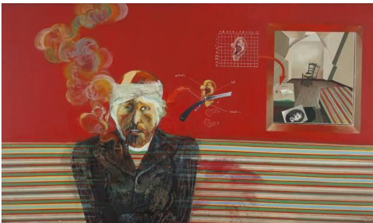
La oreja , 1972 Acrílico sobre tela, 112 x 189 cm Colección de Arte Amalia Lacroze de Fortabat

Como homenaje por el centenario de la muerte de Van Gogh, en 1990, Alonso realizó la exposición El pintor caminante en el Museo Nacional de Bellas Artes, reflexión sobre el posimpresionismo y su captura de la naturaleza, además de la constante indagación sobre el artista y sus actos. En esta serie, que acrecienta al año siguiente, entrelazó la tradición europea con la pictórica argentina, activa desde su lugar en Unquillo, las serranías cordobesas. La muestra recupera el paisaje en su autonomía desde el goce de lo pictórico, donde se borra la distancia entre la naturaleza y la pintura. También revisita temas ya constantes como la modelo desnuda en el taller, en una secuencia de tres posiciones con sutil erotismo, o con el giro sorpresivo de Van Gogh mirando un desnudo de Munch y Cataratas Nro. 1. V.G. visita a Monet . Visitas entre artistas que obligan a pensar en una historia del arte paradójicamente sincrónica.