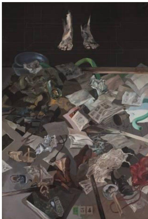
Inventario Nro. 2, 1979 Acrílico sobre tela, 196 x 130 cm Propiedad del artista