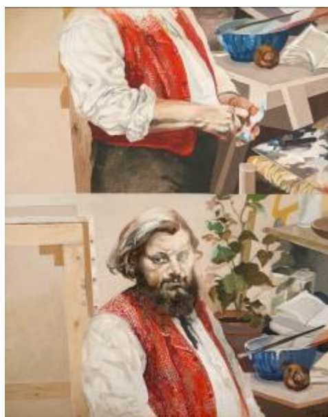
Retrato discontinuo , 1978 Acrílico sobre tela Colección Particular