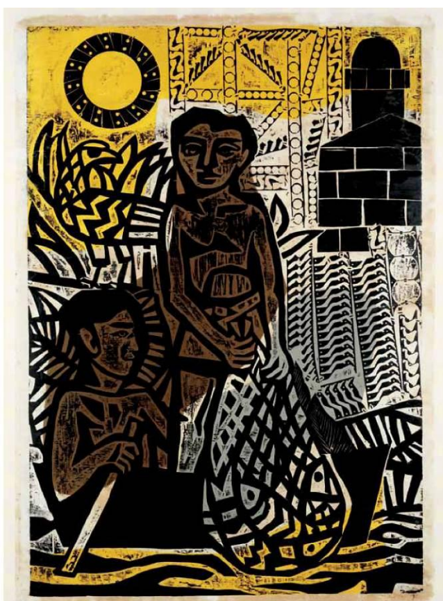
Antonio Berni, Juanito pesca con red , 1961

El recorrido comienza con un espacio poblado de pinturas costumbristas que recuerda los tiempos en que la bienal poseía la estructura de un Salón de Bellas Artes, como los grandes salones de París. Este núcleo hace hincapié en la edición de 1922, en la cual la Argentina se presenta con un amplio número de obras encauzadas en la búsqueda de una identidad nacional. La sección siguiente, ¿Cómo se representa a un país? , reproduce las tensiones entre dos criterios de selección enfrentados: el que sostiene que ésta debe plasmar el imaginario y los valores de la nación, y el que considera que debe "hablar" el lenguaje internacional del resto de los países del mundo. Aquí, el foco se ubica en los envíos de 1952, elaborado durante el gobierno peronista, y el de 1956, organizado por Jorge Romero Brest y Julio Payró durante la Revolución Libertadora.