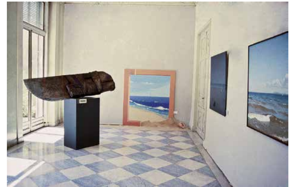
Vista Exhibición Premio Fortabat, 1986

Nacional de Bellas Artes, y mostró un panorama inusual del arte y la creación, pero ¿llegará el día en que las competiciones se realicen entre artistas de la misma generación y trayectoria?». 2