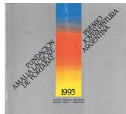
Catálogo Premio Joven Pintura Argentina, 1993