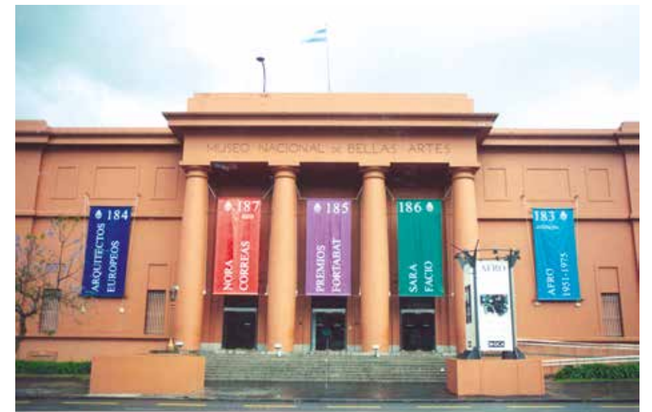
Fachada Museo Nacional de Bellas Artes, 1999

Al conflicto generacional había que agregar otro más profundo que crecía en el terreno de las opiniones y las ideas: la constante discusión entre el arte que surge de las necesidades propias de una cultura y el que entronca con las tendencias internacionales. Antonio Berni, en un artículo titulado La extrema vanguardia (1981), había acometido contra quienes pretendían trasplantar las estéticas globales al circuito local, al sostener que «La cultura, al igual que la política, en todos los tiempos, se ha dado como el “arte de lo posible”. Este “posible” no es el mismo en Nueva York, París o Buenos Aires, dado que, para la existencia de una avanzada estética, las condiciones de un país evolucionado resultan totalmente distintas a las de cualquier otro, hundido en el subdesarrollo». 8