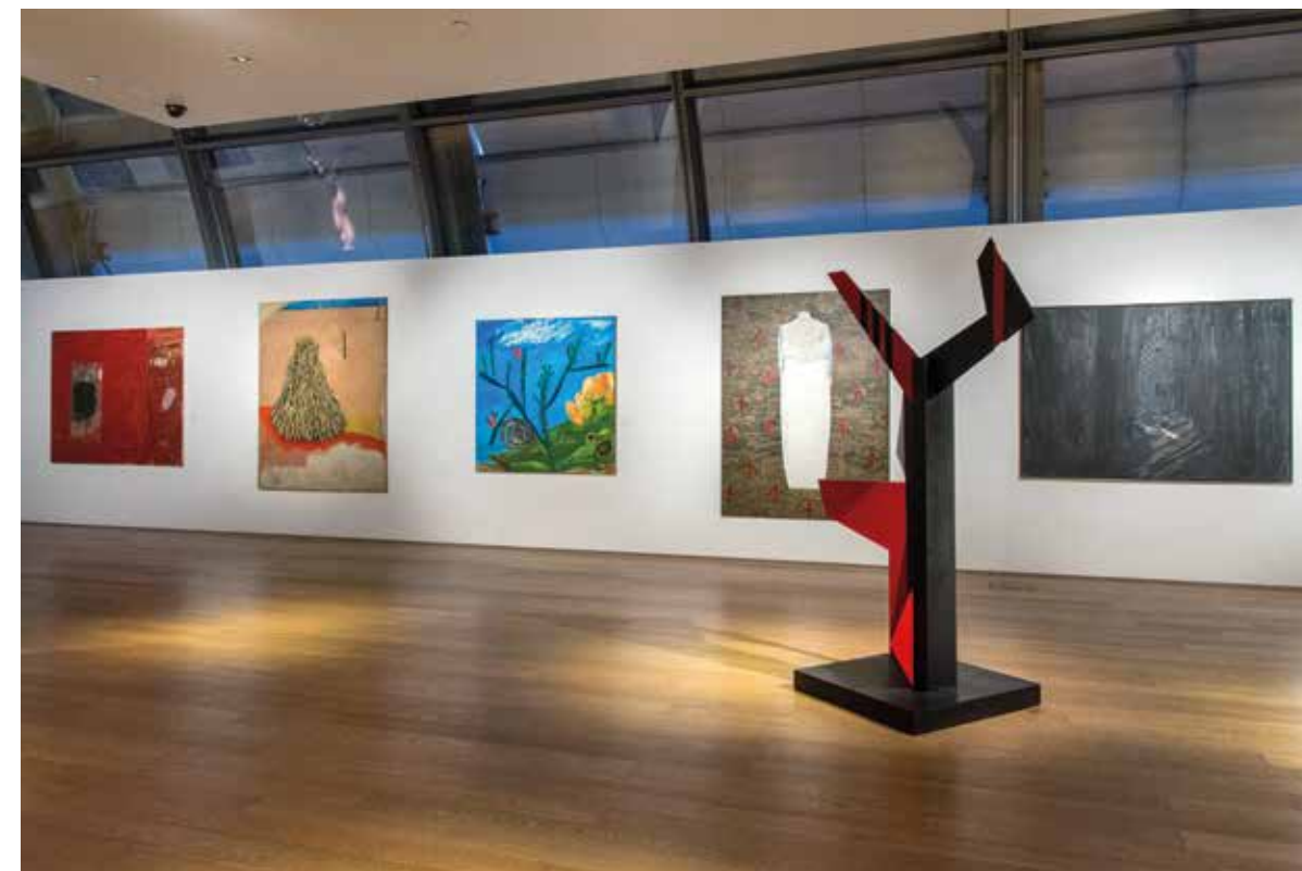
Vistas Exhibición Premios Fortabat. 1984-1999. Colección de Arte Amalia Lacroze de Fortabat. 26 de octubre de 2018 al 24 de febrero de 2019

Julio de 2019, exhibición en el Primer Piso de la Colección. Premiación.