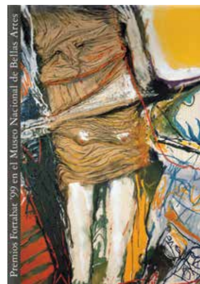
Catálogo Premios Fortabat, 1999

de los más prestigiosos del circuito plástico y era, muchas veces, la puerta de ingreso al mundo del arte para muchos creadores que se zambullían en el incierto universo de la creación estética local.