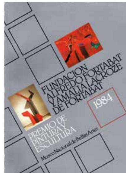
Catálogo Premio de Pintura y Escultura, 1984