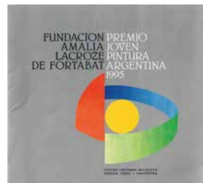
Catálogo Premio Joven Pintura Argentina, 1995