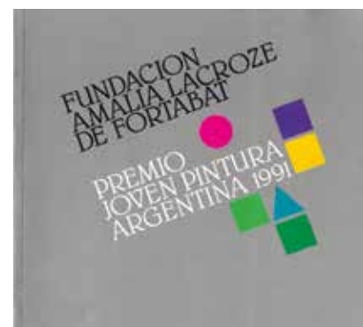
Catálogo Premio Joven Pintura Argentina, 1991