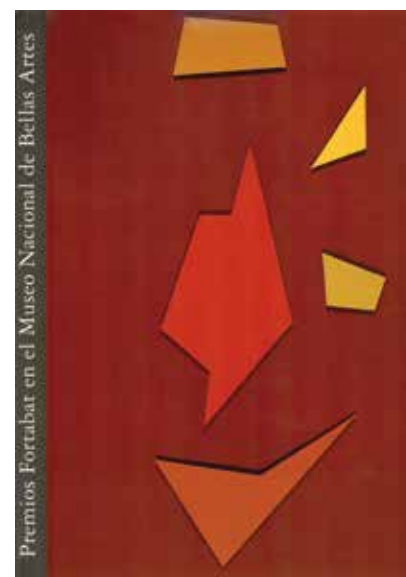
Catálogo Premios Fortabat en el Museo Nacional de Bellas Artes, 1997