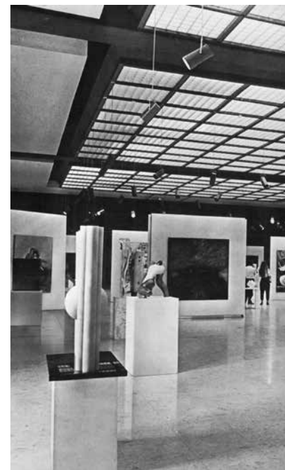
Vista Exhibición Premio de Pintura y Escultura Fortabat, 1984. Museo Nacional de Bellas Artes

No obstante, la reseña de este crítico en la revista ArtInf tuvo un efecto casi inmediato, y en la edición siguiente los Premios se dividieron en dos categorías: unos para artistas consagrados y otros para menores de cuarenta años; así se evitaba la innecesaria confrontación generacional y se permitía que los nuevos rumbos de la pintura y la escultura se manifestaran a la par de las propuestas ya consolidadas. «De tal manera —sostenía Guillermo Whitelaw en su contribución al catálogo— se ven cumplidos los propósitos que guían a la Fundación Fortabat, y en especial a su presidenta, doña Amalia Lacroze de Fortabat, quien aspira a ofrecer, cada vez que se lleva a cabo este concurso, una máxima apertura para los creadores, respetando todas las tenencias, desde las que se aproximan a lo clásico hasta los “ismos” más avanzados.» 7